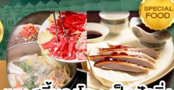
เมนู: สุกี้ม้งโก + เปิดปักกิ่ง เดินทาง เม.ษ. - ต.ค. 69