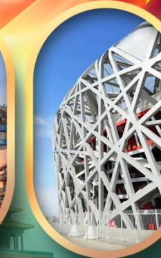
ผ่านชมสนามกีฬาฟาริงก