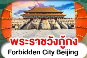
พระราชวังต้องห้าม Forbidden City Beijing