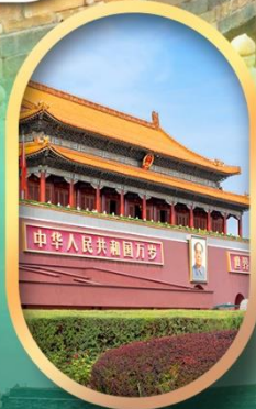
จัสมตรีสเทียนอันเหมิน