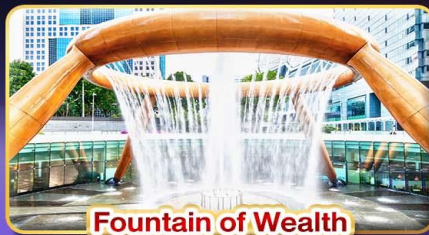
Fountain of Wealth