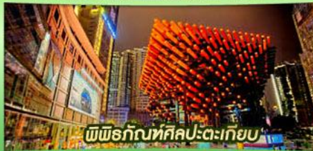
พิพิธภัณฑ์ศิลปะตะเกียบ