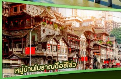
หมู่บ้านโบราณฉือฮิว