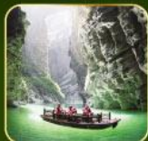
ล่องเรือแม่น้ำใต้ดินกุฮิว