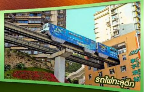
รถไฟฟ้าคุตง