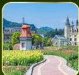
สวน Alice's Garden