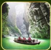
ล่องเรือแม่น้ำไตติงกุฮัว