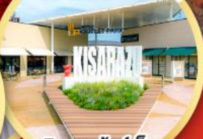
มิตซึย เอ้าท์เล็ต พาร์ค คิชะระชู