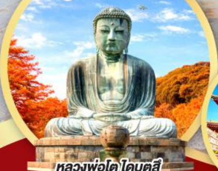
หลวงพ่อโต ไคบุตสึ