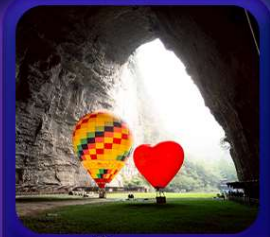
“ ถ้าถึงหลง ”