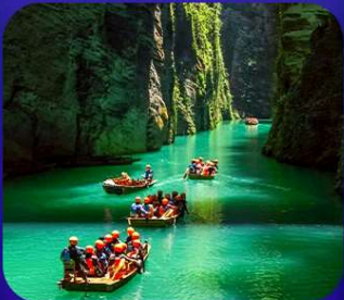
“ ผิงซานแกรนด์แคนยอน ”

เที่ยวจีน 2 มณฑล เสฉวน+หูเป่ย์ • ถ้าถึงหลง • หุบเขาสิงโต ซื่อจื่อกวน ล่องเรือมังกรกังส่วยชมวิวยามค่ำคืน • ผิงซานแกรนด์แคนยอน (รวมล่องเรือ) หงหยาดัง • จุดชมรถไฟฟ้าทะลุทิว • ตึกตะเกียบ • สือปาตี • หลงเหมินฮ่าว