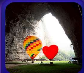
“ ถ้าเถิงหลง ”