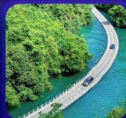
“ คุบเขาสิงโต ซื่อจื่อกวน ”