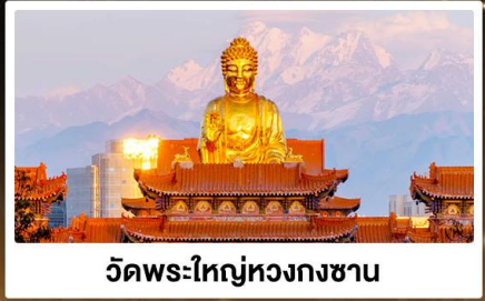
วัดพระใหญ่หวงกงชาน