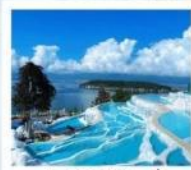
ซานโตรินี่ต้าหลี่