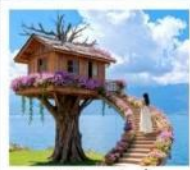
หมู่บ้านเหวินบี