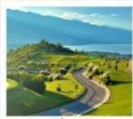
กุขาอวั้นเซียงซาน