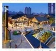
ถนนคนเดินไท่กุ่หลี่