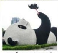
รูปปั้นแพนด้าเซลฟี่