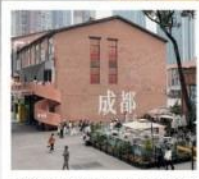
EASTERN SUBURB MEMORY