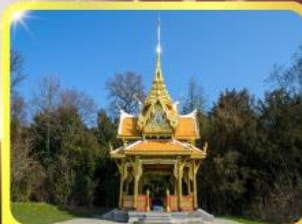
ศาลาไทยไชยาน์