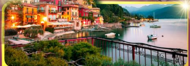
ทะเลสาบโลโบ

11-18 มิ.ย. 69 / 25 มิ.ย. - 02 ก.ค.69 02 - 09, 16-23 ก.ย.69 / 07 -14, 22-29 ต.ค.69 เดินทาง : 04 - 11, 11-18 พ.ย.69 25 พ.ย. - 02 ธ.ค.69 03 - 10, 23-30 ธ.ค.69 / 23 - 30 ธ.ค. 69 29 ธ.ค.69 - 05 ม.ค.70