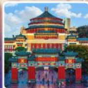
ศาลาประชาชนฉงชิ่ง