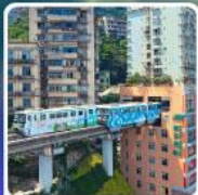
รถไฟฟ้า-ลัดติก