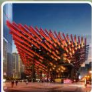
พิพิธภัณฑ์ศิลปะ-ตะเกียบ