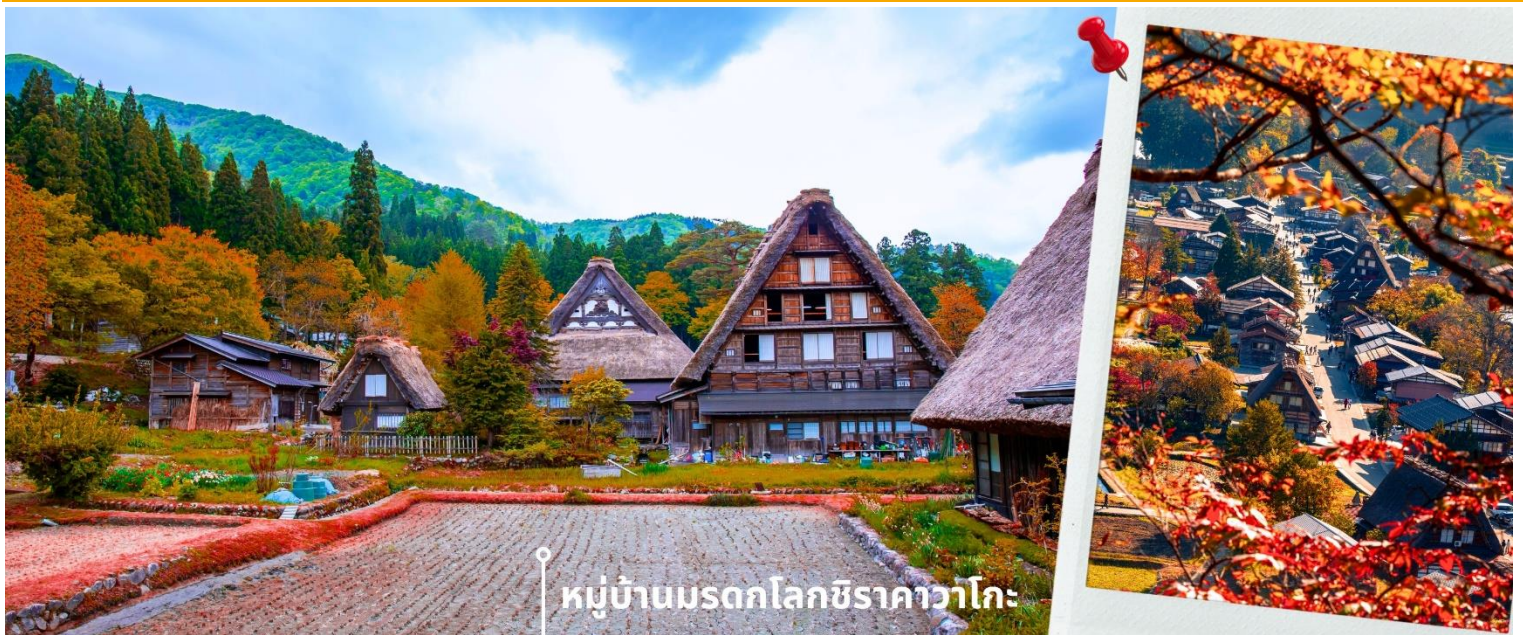
หมู่บ้านมรดกโลกชิราคาวะโกะ

จังหวัดนากาโนะ – นั่งกระเช้าโนอาร์ (รวมค่ากระเช้า) - แวะคาเฟ่ The City Bakery (ไม่รวมค่าเครื่องดื่ม) – อีออนมอลล์