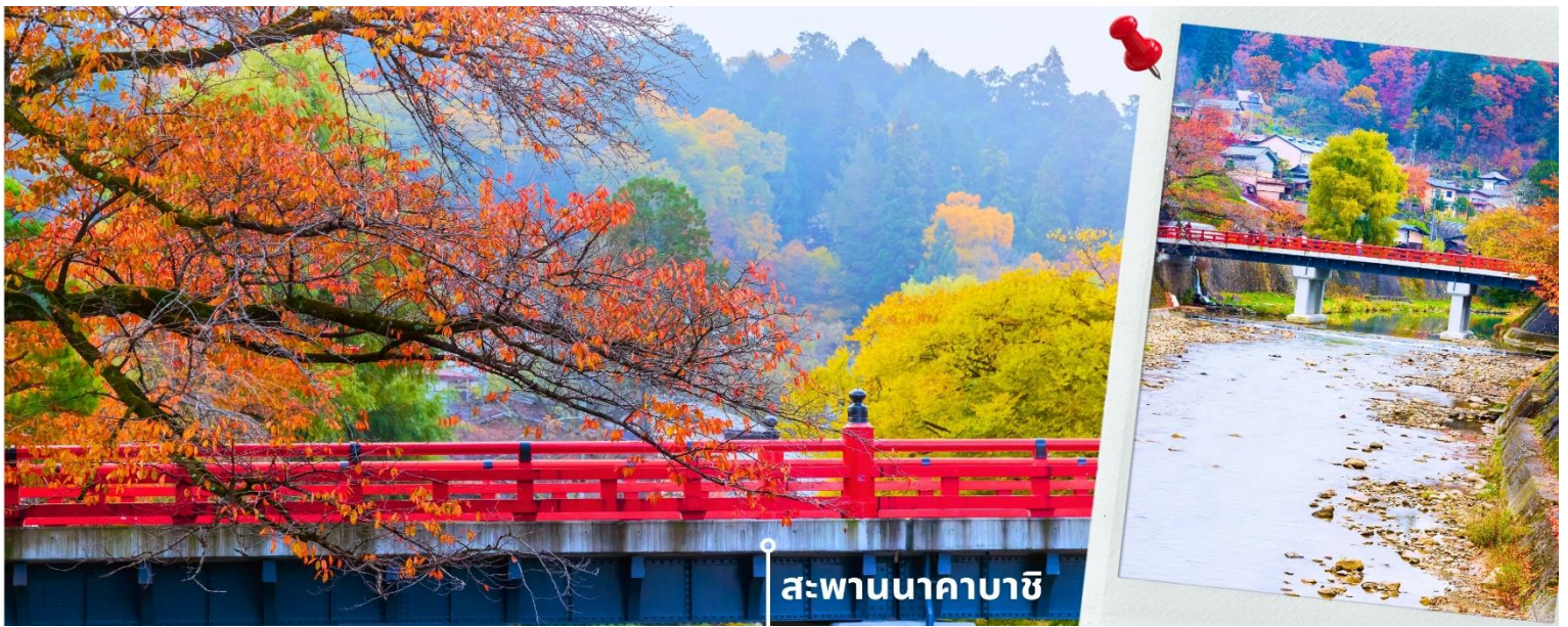
สะพานนาคาบาชิ

จากนั้นให้เวลาท่านเดินเล่นสัมผัสบรรยากาศกันต่อที่ ถนนชั้นมาจิซุจิ ซึ่งถูกขนานนามว่าเป็น “ลิตเติ้ลเกียวโต” บ้านไม้โบราณโชน้ำตาลดำ เรียงรายไปตามทางเดิน มีคูน้ำอยู่รอบเมือง ปัจจุบันได้มีการปรับเปลี่ยนเป็นร้านค้า ร้านอาหาร ของที่ระลึก สำหรับนักท่องเที่ยวให้ได้เลือกชมทั้ง ผ้าแฮนด์เมด ชุดยูกาตะ ตุ๊กตาซารุโอะโอะ