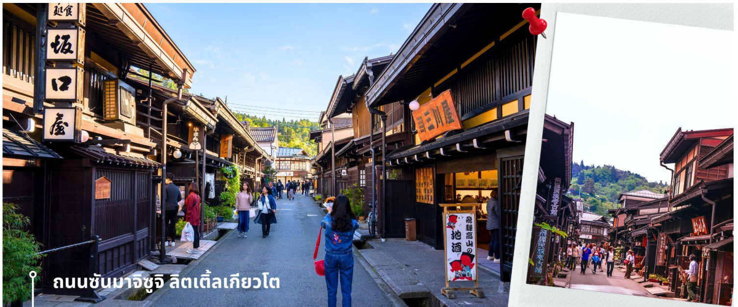
ถนนชั้นมาจิซุจิ ลิตเติ้ลเกียวโต

จากนั้นให้เวลาท่านเดินเล่นสัมผัสบรรยากาศกันต่อที่ ถนนชั้นมาจิซุจิ ซึ่งถูกขนานนามว่าเป็น “ลิตเติ้ลเกียวโต” บ้านไม้โบราณโชน้ำตาลดำ เรียงรายไปตามทางเดิน มีคูน้ำอยู่รอบเมือง ปัจจุบันได้มีการปรับเปลี่ยนเป็นร้านค้า ร้านอาหาร ของที่ระลึก สำหรับนักท่องเที่ยวให้ได้เลือกชมทั้ง ผ้าแฮนด์เมด ชุดยูกาตะ ตุ๊กตาซารุโอะโอะ