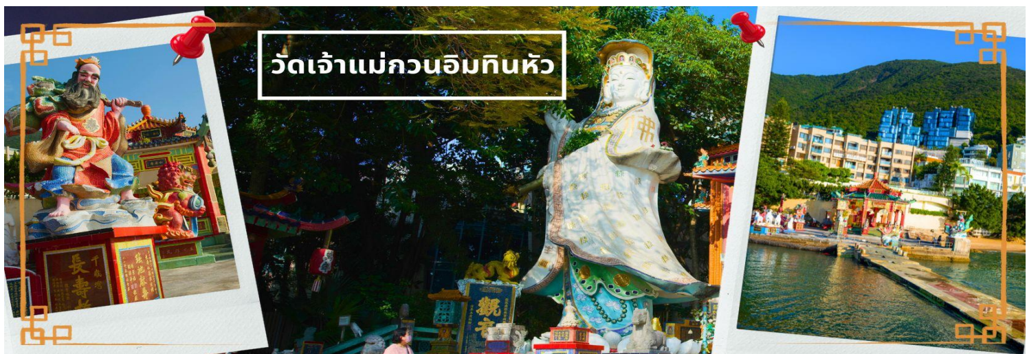
วัดเจ้าแม่กวนอิมกินหัว

เช้า ❗ บริการอาหารเช้า ณ ภัตตาคาร **เมนูติ่มซำต้นตำหรับฮ่องกง** (3)