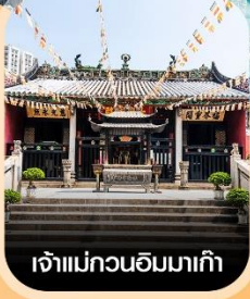
เจ้าแม่กวนอิมมาเก๊า

คอนเฟิร์มออกเดินทาง ทุกพีเรียด 2 ท่านขึ้นไป