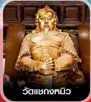
วัดแซกซงหมิว