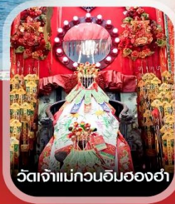
วัดเจ้าแม่กวนอิมของฮ่า