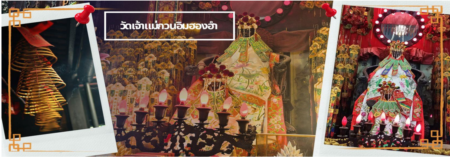
วัดเจ้าแม่กวนอิมของอำ

จากนั้นนำท่านชม โรงงานจิ๋วเวอรี่ ซึ่งเป็นโรงงานที่มีชื่อเสียงที่สุดของฮ่องกงในเรื่องการออกแบบเครื่องประดับ อาทิ เช่น จี้ และแหวนกำหั้น ที่สวยงามโดดเด่นไม่เหมือนใคร ซึ่งถือกำเนิดขึ้นที่นี่และมีชื่อเสียงที่สุดใช้เป็นเครื่องประดับติดตัว และเสริมดวงชะตา สินค้าทุกชิ้นมีเอกสารรับประกันคุณภาพเปลี่ยน ซ่อม ได้ตลอดอายุการใช้งาน หากเกิดการ