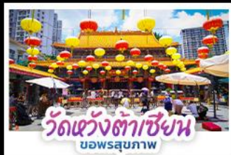
วัดเซว้งต้าเซียน บอพรสุภภาพ