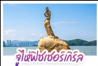
จูเซีฟิซเซอร์เทิร์ล