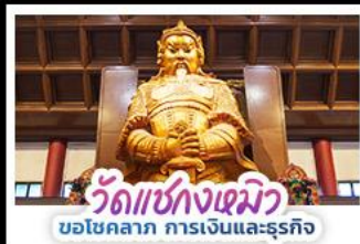
วัดเซ่งกวงเมียว บอไซคลาก การเงินและธุรกิจ