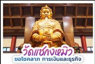
วัดเซ่งก่งเมียว ขอโชคลาภ การเงินและธุรกิจ