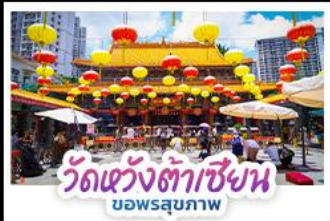
วัดเซว้งต้าเซียน บอพรสุภภาพ