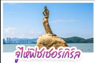
จูเซีฟิซเซอร์เทิร์ล