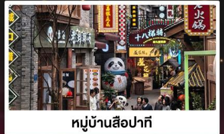
หมู่บ้านสี่牌坊