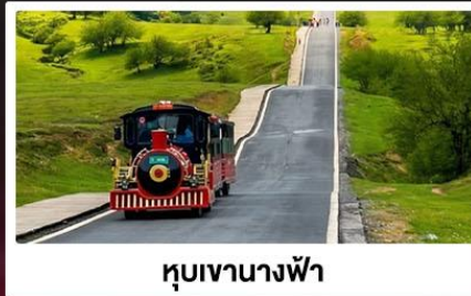
หุบเขานางฟ้า