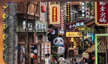
หมู่บ้านสี่ปาตี้