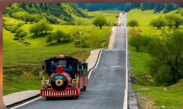
ทิวเจานางฟ้า