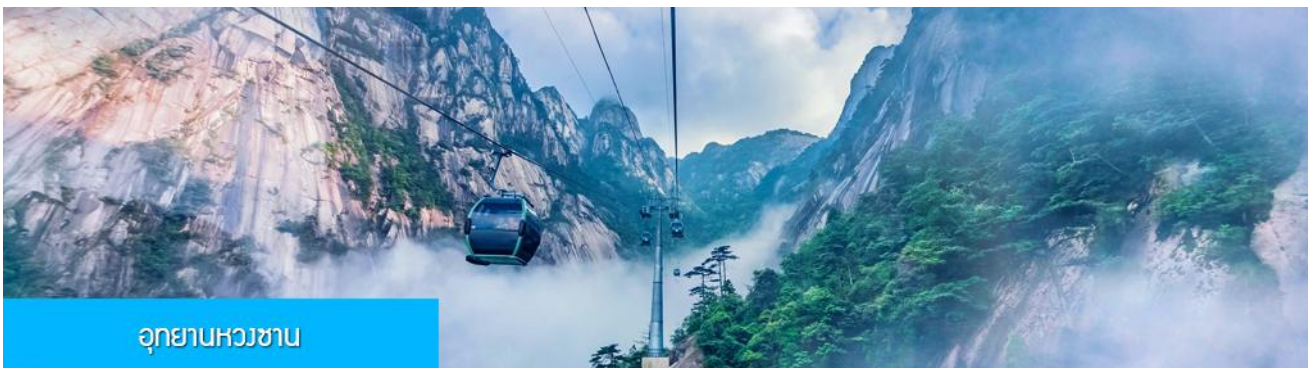
อุทยานหวงชาน