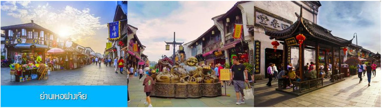
ย่านเหอฝางเจีย