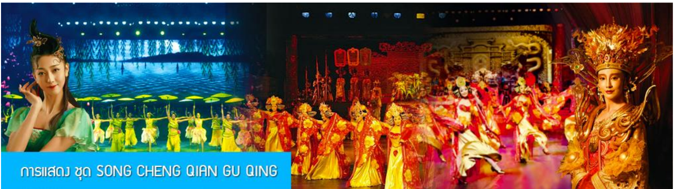
การแสดง ชุด SONG CHENG QIAN GU QING

พักที่ โรงแรม VIENNA HOTEL หรือเทียบเท่าในเมืองหังโจว