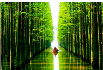
สวนป่าไม้ลอยน้ำชิงซานหู

พักที่ PAIJING HOLIDAY HOTEL โรงแรมระดับ 4 ดาวท้องถิ่น หรือเทียบเท่า เมืองหวงซาน