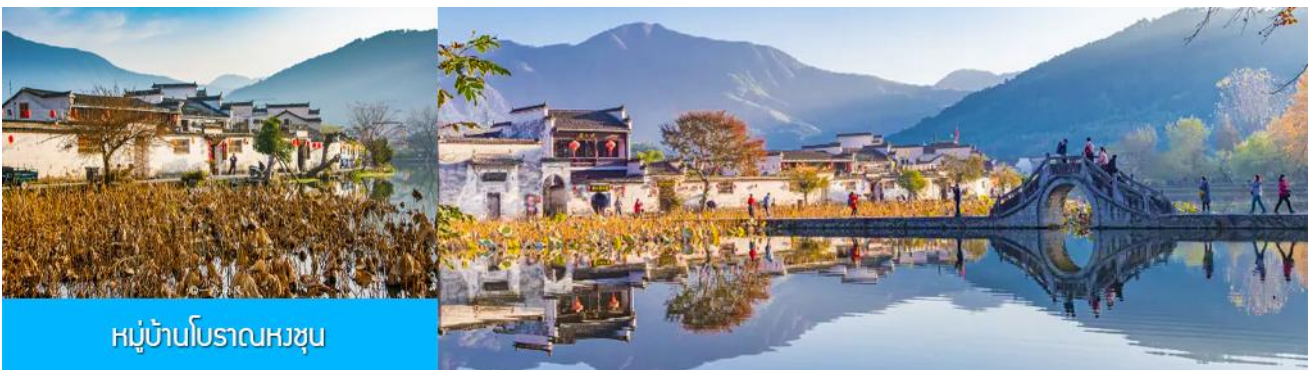
หมู่บ้านโบราณหวซุน

ไกด์ท้องถิ่นนำเสนอโปรแกรมทัวร์เสริมบัตรชมการแสดงชุด ตำนานรักเมืองซ่ง 宋城千古情 การแสดงภายในโรงละครที่ดีที่สุด และได้รับรางวัลมากที่สุดของประเทศจีนจีน.....อัตราค่าบริการสำหรับโปรแกรมเสริม ท่านละ 380 หยวนหรือ 1,900 บาท ใช้เวลาประมาณ 90 นาที ค่าบริการรวม ค่าตัวชมการแสดง ค่ารถบัสรับ และค่าน้ำดื่มของไกด์ท้องถิ่น