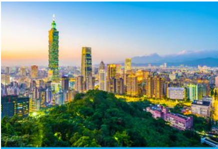
เมืองหวงซาน