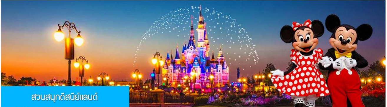
สวนสนุกดิสนีย์แลนด์

พักที่ โรงแรม Tongpai Hotel or Fangyi Hotel 4* หรือเทียบเท่าในเมืองเชียงใหม่