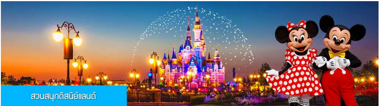
สวนสนุกดิสนีย์แลนด์

พักที่ โรงแรม Tongpai Hotel or Fangyi Hotel 4* หรือเทียบเท่าในเมืองเชียงใหม่