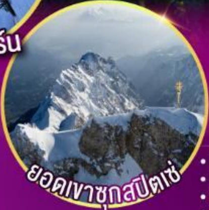
ยอดเขาชุกสปีตเซ