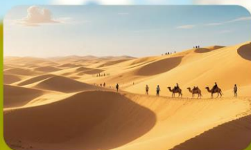
เนินทรายอินเคินทาลา