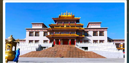
คฤหาสน์พุทธบูชาแห่งชีวิตยูลาน