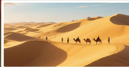
เนินทรายอินเคินทาลา