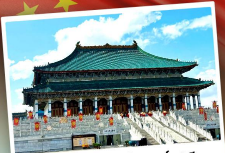
พระราชวังต้องห้ามออร์ดอส