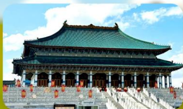
พระราชวังต้องห้ามออร์ดอส