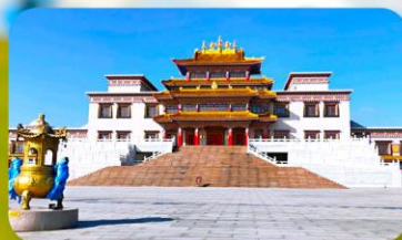
คฤหาสน์พุทธบูชาแห่งชีวิคยูลาน