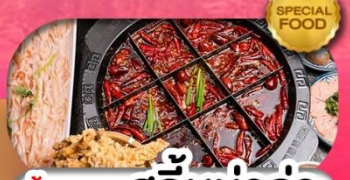
มือพิเศษ สุกี้หมาล่า