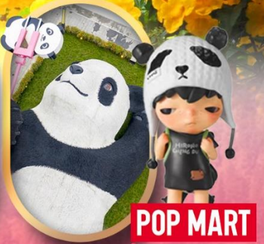
POP MART หมีแพนด้าเซลฟ์