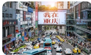
ถนนอาหารกวนอันเฉียว