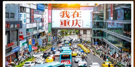
ถนนอาหารถวอนอินเดีย