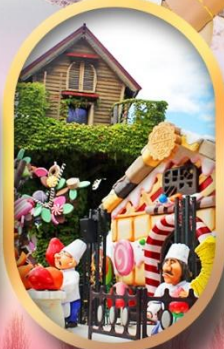
โรงงานช็อกโกแลต