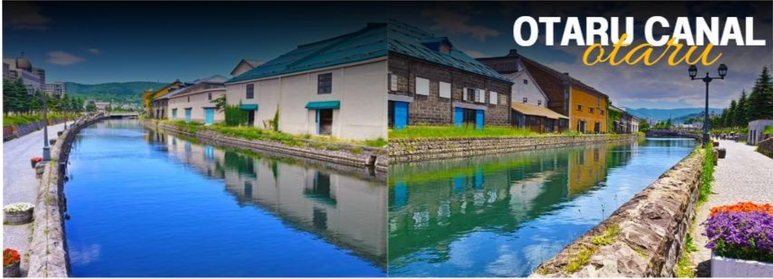
OTARU CANAL otaru

นำทุกท่านเดินทางสู่ เมืองโอตารุ เมืองท่าที่เจริญรุ่งเรืองในฐานะที่เป็นเมืองค้าขายในช่วงปลายศตวรรษที่ 19 ถึง 20 และยังเป็นเมืองมีชื่อเสียงเกี่ยวกับการทำเครื่องแก้วที่สวยงาม และมีสไตล์รูปทรงอันเป็นเอกลักษณ์คลองโอตารุ สัญลักษณ์ของเมืองโอตารุที่ได้รับความนิยมถ่ายภาพ มีฉากหลังเป็นหลังคาอาคารก่ออิฐแดง โดยคลองโอตารุสร้างเสร็จในปี 1923 ถือเป็นคลองที่เกิดจากการถมทะเล ใช้เป็นเส้นทางขนถ่าย สินค้าจากเรือใหญ่ ลงสู่เรือขนถ่าย แล้วนำสินค้ามาเก็บไว้ภายในโกดัง แต่ภายหลังได้เลิกใช้และถมคลองครึ่งหนึ่งทำเป็นถนนหลวงสาย 17 ส่วนที่เหลือไว้ครึ่งหนึ่งก็ได้ทำการปรับปรุงเป็นสถานที่ท่องเที่ยว ทั้งยังปรับปรุงทางเดินเลียบบคลองด้วยอิฐสีแดง