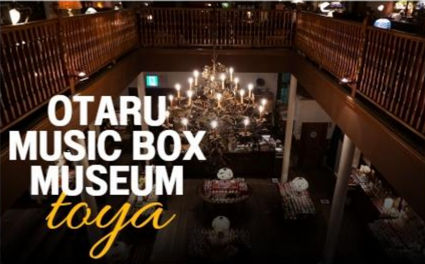
OTARU MUSIC BOX MUSEUM toya

นำทุกท่านเดินทางสู่ พิพิธภัณฑ์กล่องดนตรี (MUSIC BOX) ท่านจะได้ชมกล่องดนตรีมากมาย หลากหลายแบบน่ารักๆ เต็มไปหมดมากกว่า 3,000 แบบ รวมถึงท่านยังสามารถเลือกทำกล่องดนตรีแบบที่ท่านต้องการได้ด้วย ท่านสามารถเลือกกล่องใส่ ตุ๊กตาเซรามิกและเพลงมาประกอบกัน มีบริการนำเพลงกล่องดนตรีทั้งเพลงญี่ปุ่นและเพลงสากลมาอัดเป็นซีดีไปสการ์ดส่งได้