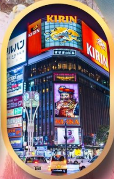
ช้อปปิ้งย่านซูซุกิโนะ