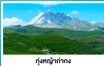
ทุ่งหญ้าท่ามกลาง