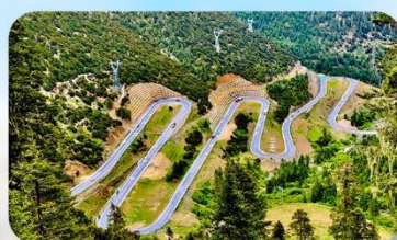
ถนน 18 โค้ง