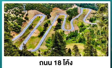
ถนน 18 โค้ง