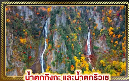
น้ำตกทิงกะ และน้ำตกริวเซ