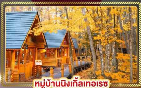
หมู่บ้านนิงเกิ้ลทอเรซ