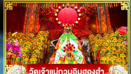
วัดเจ้าแม่กวนอิมสองฮ่า