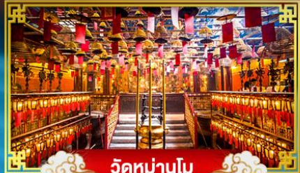
วัดม่านโม

พักกลางวัน "จิมซาร์จ" ปีนหอดมองเทศกาลปีใหม่ ณ เกาะฮ่องกง