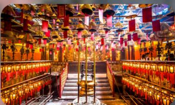
วัดหม่านโม