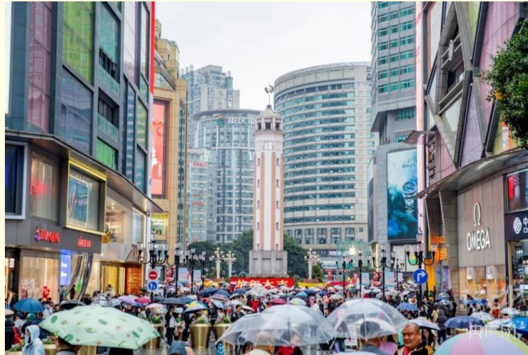
ถนนคนเดินเจี๋ยฟางเป่ย์

และนำท่านไป ถนนคนเดินเจี๋ยฟางเป่ย์ (Jiefangbei Street) ตั้งอยู่บริเวณอนุสาวรีย์ปลดแอก ซึ่งสร้างขึ้นเพื่อรำลึกถึงชัยชนะในการทำสงครามกับญี่ปุ่น แต่ปัจจุบันกลายเป็นศูนย์กลางทางการค้าขนาดใหญ่ ใจกลางเมือง เต็มไปด้วยร้านค้ามากกว่า 3,000 ร้าน ซึ่งมีทั้งอาหาร ซ้อปิ้ง มอลล์ขนาดใหญ่ ให้ท่านได้เดินชมและซ้อปิ้งกันอย่างจุใจ.