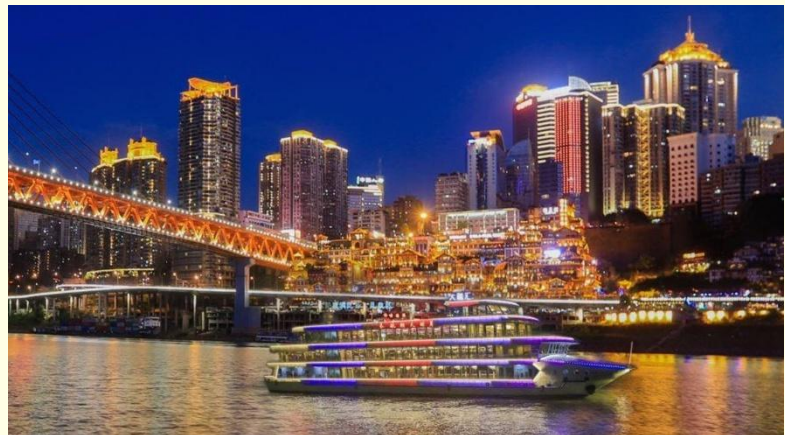
Option เสริม ล่องเรือราตรีชมแม่น้ำสองสาย

*ราคาทัวร์นี้ยังไม่รวมค่าบริการค่าล่องเรือ สำหรับท่านที่สนใจจะมีค่าบริการท่านละ 300 หยวน (ราคาอาจมีการเปลี่ยนแปลง กรุณาตรวจสอบราคาก่อนซื้ออีกครั้ง)*