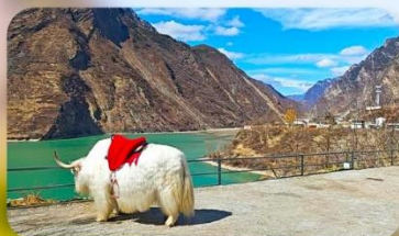
กะเลสาบเต๋อซี