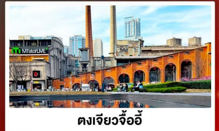
ตงเจียวจ้ออ๊