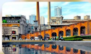
ตงเจียวจื่ออี้