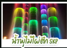
น้ำพุไม้ไผ่ตึก SKP

ภูเขาสี่ดรุณี • อุทยานหวงหลง • เมืองโบราณชงพาน • ทะเลสาบต่อซี อุทยานจิวจ้ายโกว • จิตรกรรมฝาผนังเกียนหวู่ • รูปปั้นหมี่แพนด้าเซลฟี ถนนโบราณชอยกวางฮอยแคบ • ถนนคนเดินไท่ทู่หลี่ • ถนนคนเดินซุนซี แพนด้ายักษ์ปิ่นตึก ณ ตึก IFS • วัดต้าอิว • น้ำพุไม้ไผ่ตึก SKP