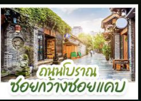
ถนนโบราณ ชอยกวางฮอยแคบ