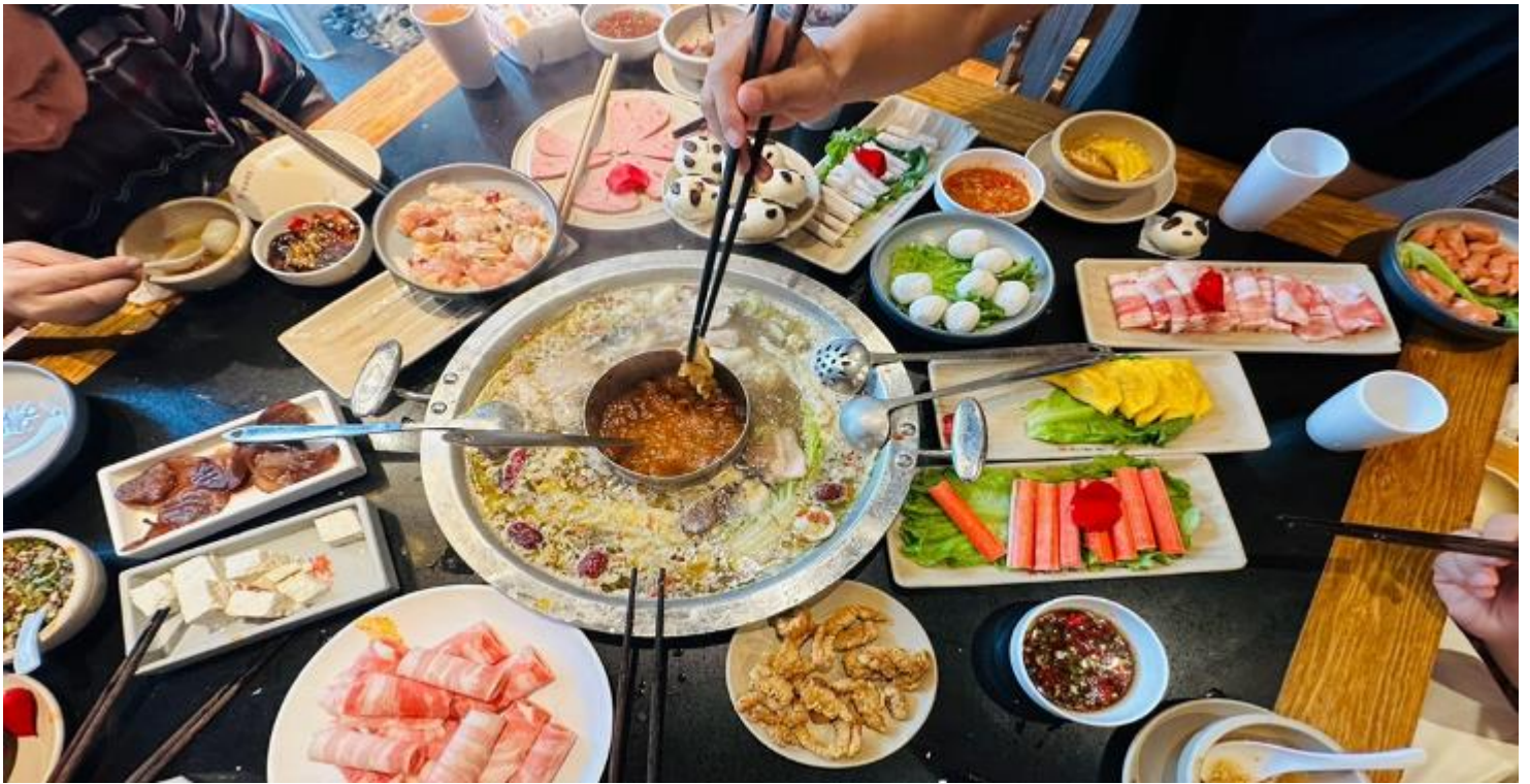
คำ รับประทานอาหารคำ ณ ภัตตาคาร (เมื่อที่ 12) *เมนูพิเศษสุกี้หมอลำเสฉวน