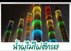
น้ำพุไม้ไผ่ตึกSKP