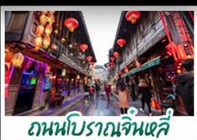
ถนนโบราณจินหลี่