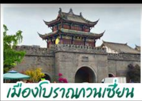
เมืองโบราณทวนชั่งน

ภูเขาสิ่วครุณี - อุทยานปู้ผิงโกว - สะพานหนานเฉียว - ร้านหนังสือจงซูเก้อ - เมืองโบราณกวนเหลียน จดรัสหย่างเทียนหวู่ - หมีแพนด้าซาฟี่ - ถนนโบราณซอยกว้างซอยแคบ - ถนนคนเดินไท่กู๋หลี่ ถนนคนเดินซุนซี - ถนนโบราณจินหฺลี - แพนด้ายักษ์ปิ่นตึก - น้ำพุไม้ไผ่ตึกSKP - วัดต้าเจ้อ