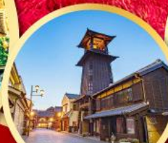
ลิตเติลเอโดะ เมืองควาโกเอะ