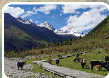
ทุ่งหญ้าเหรินเชินกั๋วผิง (Renshou Guosheng)