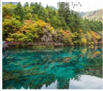
ทะเลสาบห้าสี