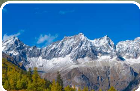
จุดชมวิว (Hongshanlin)