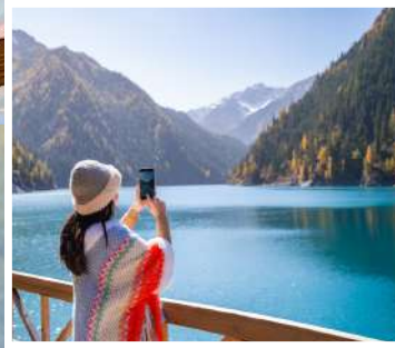
ทะเลสาบยาว