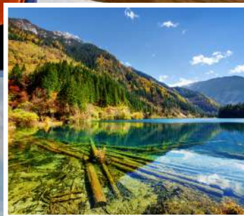
ทะเลสาบไผ่ลูกศร