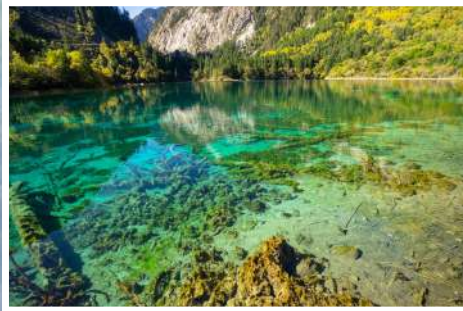
ทะเลสาบนกยูง