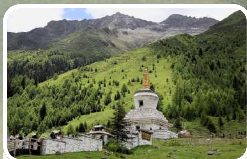
ปู้ตาลาเฟิง (Potala Peak)