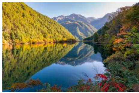
ทะเลสาบกระจก