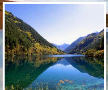
ทะเลสาบแสด