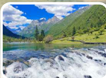
ทะเลสาบหลงจู่ชวี่ (Long zhu cho lake)