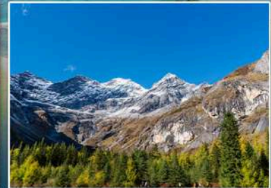
อุทยานสีดรุณี

แพ็คเกจท่องเที่ยว ตามโปรแกรม พร้อมคนขับรถ