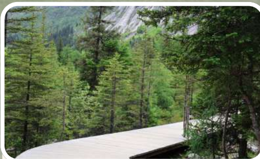
ป่าหรงชานหลิง (Redwood Forest)