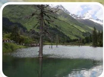
ซีอู๋นาคัว (Sigu Nacuo)