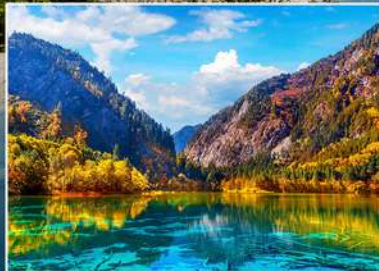
อุทยานจิวโจโก