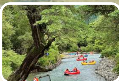
เหินยวนหุยป่า (Redwood Forest)