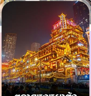
ตลาดหรงหยาดัง