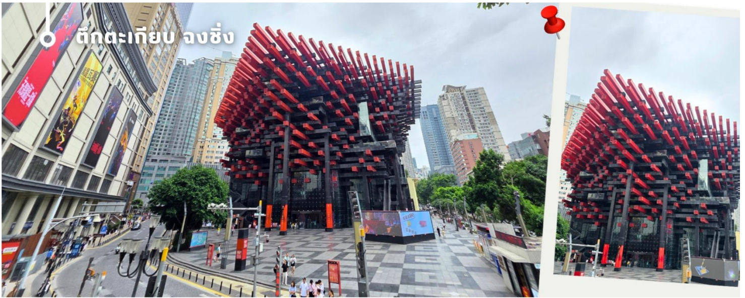
ตึกตะเกียบ จงชิ่ง

เอกลักษณ์ อาคารนี้ถูกวางโครงสร้างให้มีรูปร่างคล้ายกอง "ตะเกียบยักษ์" สีดำและแดงที่วางซ้อนกันเป็นชั้นๆ ที่ส่วนปลายของตะเกียบสีแดงจะมีตัวอักษรจีนคำว่า "กั่ว" ประทับอยู่ ซึ่งมีความหมายถึง ชาติหรือประเทศ ส่วนที่ปลายตะเกียบสีดำ จะมีอักษรจีนคำว่า "ไท่" ประทับอยู่ ซึ่งหมายถึง ความเงียบสงบ หรือความอุดมสมบูรณ์