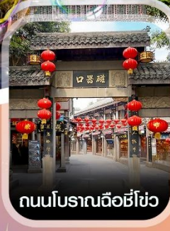
ถนนโบราณฉือชี่ไช่