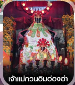
เจ้าแม่กวนอิมฮ่องงำ