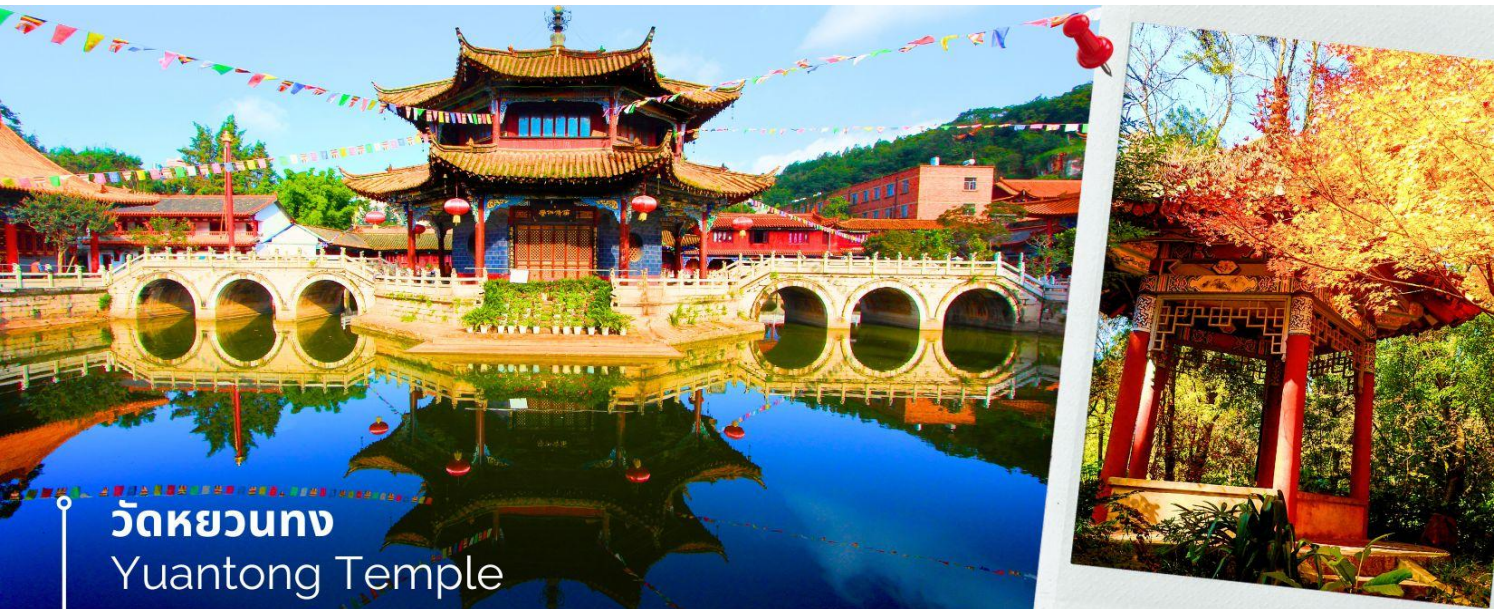
วัดหยวนตง Yuanton Temple

นำท่านชม วัดหยวนตง (Yuanton Temple) วัดแห่งนี้เป็นวัดที่ใหญ่และเก่าแก่ที่สุดในเมืองคุนหมิง สร้างมาตั้งแต่สมัยราชวงศ์ถัง มีอายุยาวนานประมาณ 1,200 กว่าปี การสร้างวัดแห่งนี้จะแปลกตากว่าวัดอื่นในจีน เพราะปกติแล้วการสร้างวัดของจีนส่วนมากจะต้องสร้างอยู่บนภูเขา แต่วัดหยวนตงสร้างวัดต่ำกว่าภูเขา โดยวิหารจะอยู่ต่ำที่สุด เนื่องจากวัดแห่งนี้ไม่ได้สร้างขึ้นเพื่อเป็นวัดโดยตรง แต่เคยเป็นศาลเจ้าแม่กวนอิมมาก่อน