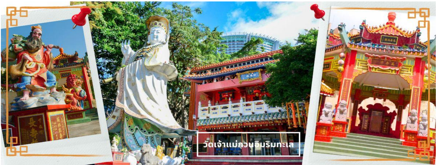
วัดเจ้าแม่กวนอิมรับทะเล

ที่สุดของฮ่องกง บริเวณวัดจะมี เจ้าแม่กวนอิมองค์ใหญ่ ปางประทานพรตั้งอยู่ เป็นเทพที่ชาวฮ่องกงและคนจีนให้ความเคารพนับถือมากที่สุด สามารถขอพรได้ทุกเรื่อง วัดนี้เป็นที่นิยมมีนักท่องเที่ยวเดินทางมาขอพรกันมากมาย เพราะเชื่อในความศักดิ์สิทธิ์ และยังมีเจ้าแม่ทับทิม หรือเทพธิดาแห่งท้องทะเลองค์ใหญ่ ซึ่งคนฮ่องกง คนมาเก๊า และคนจีน ที่อยู่ริมทะเล ชาวประมง นักเดินเรือหรือผู้ที่เดินทางทางเรือเป็นประจำ จะนับถือเจ้าแม่ทับทิมเป็นอย่างมาก มีความเชื่อว่าเจ้าแม่ทับทิมจะปกป้องเราจากภัยอันตรายระหว่างการเดินทาง ภายในวัดยังมีเทพเจ้าและพระพุทธรูปต่างๆ ประดิษฐานไว้มากมายตามความเชื่อถือศรัทธา เช่น เทพเจ้าไฉ่ซิงเอี้ย ไหว้ขอโชคลาภความมั่งคั่ง ความร่ำรวย, พระสังกัจจายน์ โพธิสัตว์ เทพประทาน บุตร-ธิดา ไหว้อธิษฐานขอลูก, สะพานต่ออายุ (สะพานอายุยืน) สะพานสีแดงตั้งอยู่บนริมหาด สีแดงสด เชื่อกันว่า คนจีนเชื่อกันว่าหากเดินข้ามสะพานนี้ เราจะมีอายุยืนขึ้นอีก 3 วัน (3 วัน บนสวรรค์ = 3 ปี บนโลกมนุษย์) นั้นหมายความว่า ถ้าเราเดินข้ามสะพานนี้แล้ว จะมีอายุยืนยาวขึ้นอีก 3 ปี บนโลกมนุษย์, เทพเจ้าแห่งความรัก ไหว้ขอเนื้อคู่, ศาลา 8 เหลี่ยม เชื่อกันว่าเป็นจุดที่มีดวงจ้ายดีที่สุด ภายในศาลาแปดเหลี่ยม จุดกึ่งกลางของพื้นจะมีรูป