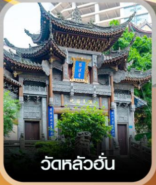
วัดหลิวอัน