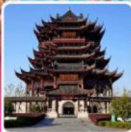
วัดหลงหยวน