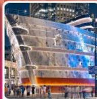
เรือหลุยส์