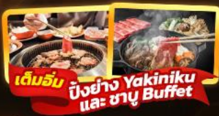
เต็มอิ่ม ปิ้งย่าง Yakiniku และ ชาบู Buffet