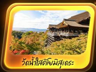
วัดน้ำใสคิโยมิสุเดระ