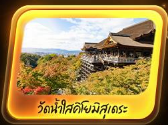
วัดน้ำใสคิซุจิมีสุโระ