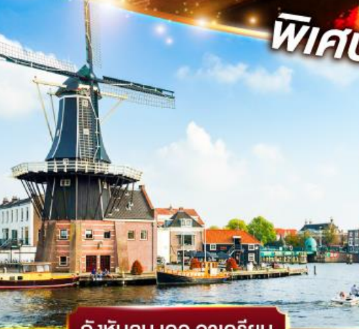
กังหันลม เดอ อาครีเยน