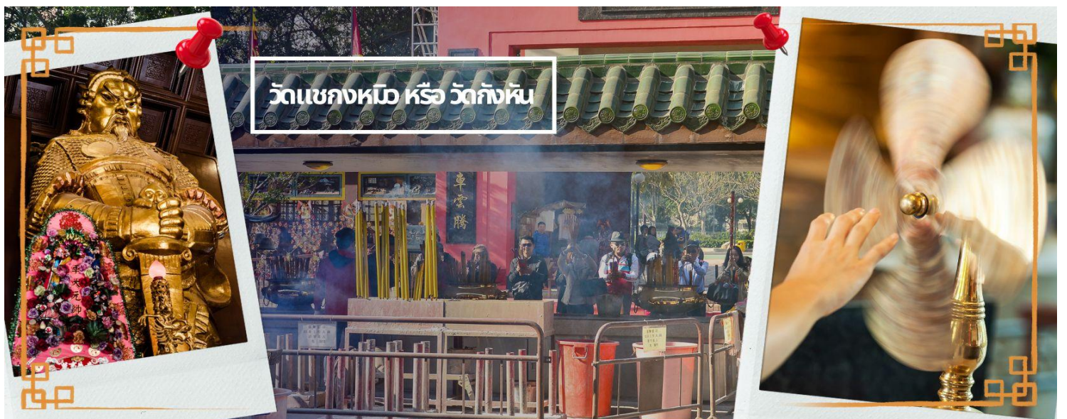
วัดแขกหนือ หรือ วัดกังหัน

นำท่านเดินทางสู่ วัดแขก ที่ซาถิ้น (CHE KUNG TEMPLE AT SHA TIN) วัดแขกสร้างขึ้นเพื่อเป็นอนุสรณ์เพื่อรำลึกถึงตำนานแห่งนักรบราชวงศ์ซ่ง มีนามว่า “แซ กง” แม่ทัพปราบศึก ผู้คนทั่วทุกดินแดนต่างยำเกรงในกำลังพลอันกล้าหาญแข็งแกร่งของแม่ทัพแขก ตั้งอยู่ในเขต SHATIN มีประวัติเล่าต่อกันมาว่า ขณะที่แม่ทัพปราบศึกอยู่นั้น ทุกแคว้นเขตแดนแผ่นดินใหญ่ต่างก็ยำเกรงต่อกำลังพลที่กล้าหาญในกองทัพของท่าน ยามที่ออกรบเพื่อต้านข้าศึกศัตรูทุกทิศทาง ทุก ๆ ครั้ง ท่านใช้สัญลักษณ์รูปกังหัน 4 ใบพัดติดไว้ด้านหลังรถศึกนำขบวนในกองทัพ เหล่าทหารกล้ามีความเชื่อว่าเมื่อพกพาสัญลักษณ์รูปกังหันนี้ไป ณ ที่ใด ๆ กังหันนี้จะช่วยเสริมสิริมงคล นำพาแต่ความโชคดี มีอำนาจเข้มแข็ง เสริมกำลังใจให้แก่กองทัพของท่าน ชื่อเสียงในการนำทัพสู้ศึกของท่านจึงเป็นตำนานมาจนทุกวันนี้ ปัจจุบันวัดแขก จึงเป็นสถานที่สักการะเคารพ ขอพร ท่านแขก โดยมีสัญลักษณ์เป็นกังหันนำโชคนั่นเอง 🌀 การหมุนกังหันนำโชคที่ตั้งอยู่ในวัด เพื่อจะได้หมุนเวียนชีวิตของเราและครอบครัวให้มีความเจริญก้าวหน้าด้านหน้าที่การงาน