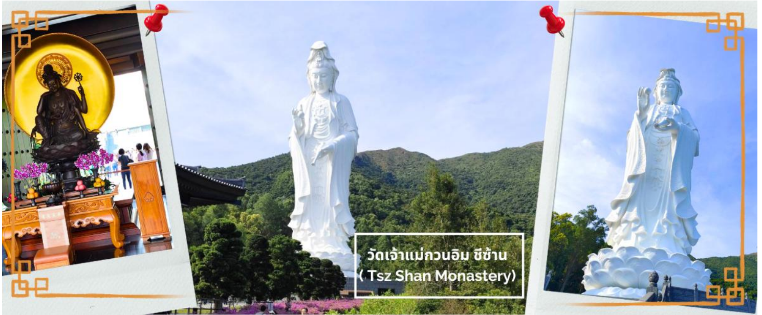
วัดเจ้าแม่กวนอิม ซีซ่าน (Tsz Shan Monastery)

📍 บริการอาหารกลางวัน (4) เมนูพิเศษ ชาบูชาบูบุฟเฟ่ต์สไตล์ฮ่องกง