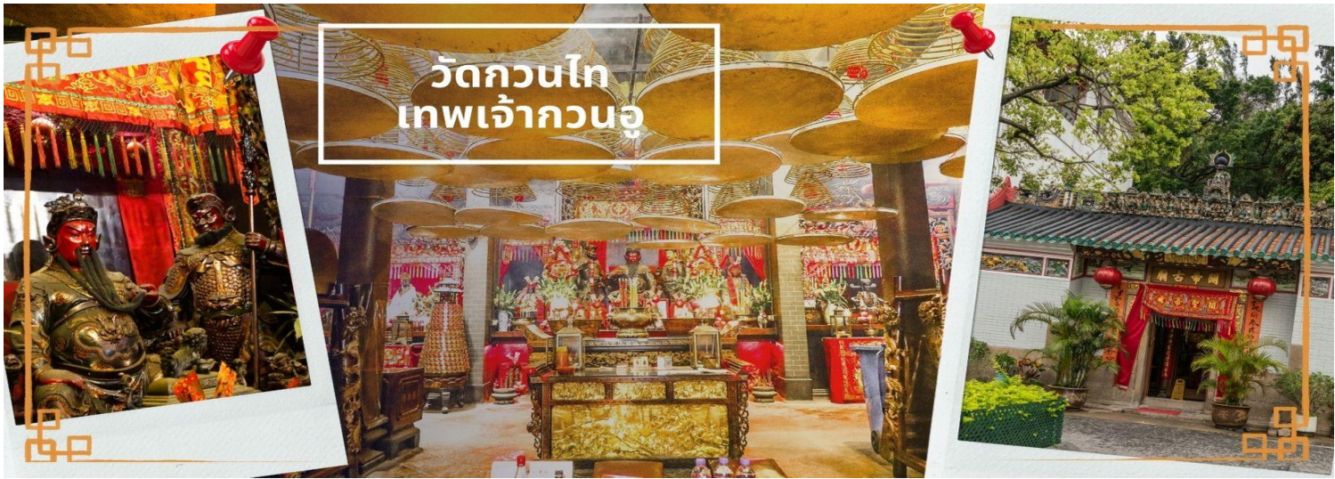
วัดกวนไท เทพเจ้ากวนอู

จากนั้นนำท่าน ไหว้ขอพรเรื่องเดินทาง การติดต่อ ค้าขาย วัดเจ้าแม่ทับทิมทินหัว (Tin Hau Temple) ที่ Yau Ma Tei เป็นวัดเก่าแก่ขนาดเล็ก อายุกว่า 150 ปี มีต้นกำเนิดมาจากวัดเล็กๆ ใน พื้นที่ตลาด Kwun Chung เคยเป็นหมู่บ้านชาวประมงมาก่อน ตั้งแต่ปี 1864 เป็นวัดที่อุทิศให้กับทินโหว่ (หมาโจ้ เทพเจ้าแห่งท้องทะเล) มีบรรยากาศที่สงบ ร่มรื่น ติดกับสวนสาธารณะเล็ก ๆ และนักท่องเที่ยวยังไม่พลุกพล่านมากจุดเด่นที่แนะนำคือ การปิดทองเรือมังกร เพื่อการทำงานการค้า ธุรกิจ ให้เจริญรุ่งเรือง