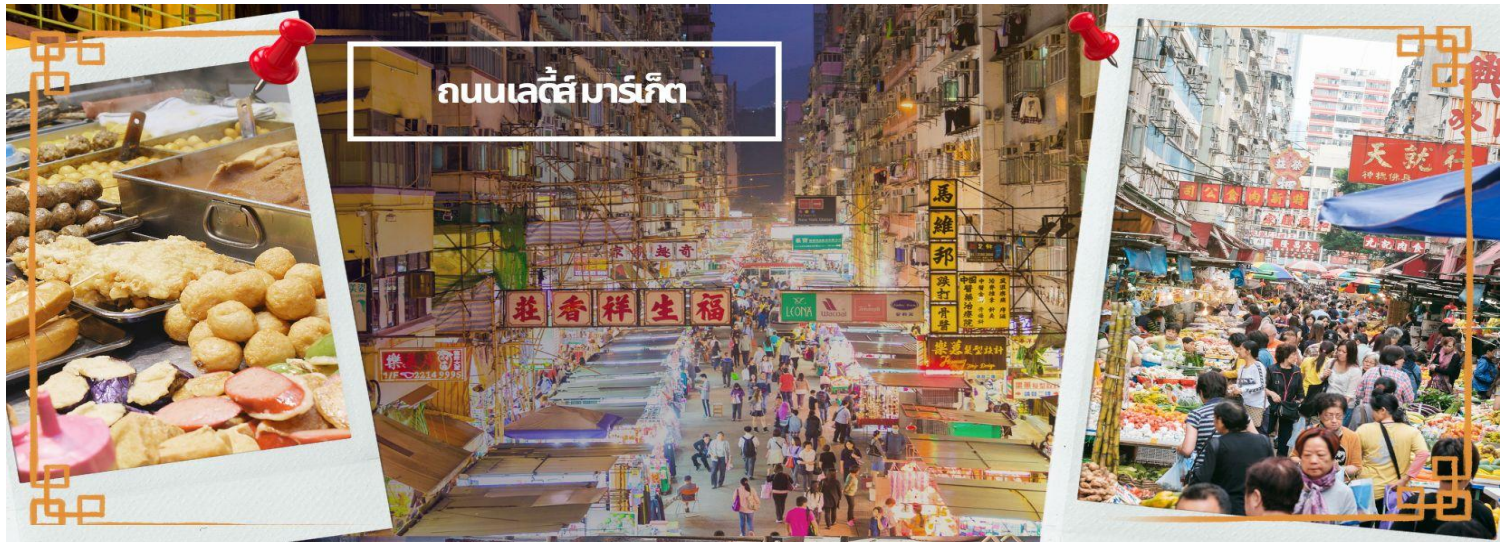
ถนนเลดี้มาร์เก็ต

นำท่านเดินทางเข้าสู่ที่พัก RAMADA GRAND HOTEL/BEST WESTERN PLUS HOTEL ★★★★★ หรือเทียบเท่า ★★★★★ หรือเทียบเท่า