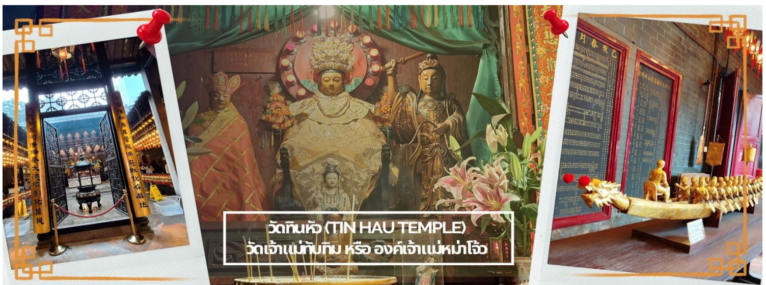
วัดทินหัว (TIN HAU TEMPLE) วัดเจ้าแม่ทับทิม หรือ องค์เจ้าแม่หมาโจ้

จากนั้นนำท่าน ไหว้ขอพรเรื่องเดินทาง การติดต่อ ค้าขาย วัดเจ้าแม่ทับทิมทินหัว (Tin Hau Temple) ที่ Yau Ma Tei เป็นวัดเก่าแก่ขนาดเล็ก อายุกว่า 150 ปี มีต้นกำเนิดมาจากวัดเล็กๆ ใน พื้นที่ตลาด Kwun Chung เคยเป็นหมู่บ้านชาวประมงมาก่อน ตั้งแต่ปี 1864 เป็นวัดที่อุทิศให้กับทินโหว่ (หมาโจ้ เทพเจ้าแห่งท้องทะเล) มีบรรยากาศที่สงบ ร่มรื่น ติดกับสวนสาธารณะเล็ก ๆ และนักท่องเที่ยวยังไม่พลุกพล่านมากจุดเด่นที่แนะนำคือ การปิดทองเรือมังกร เพื่อการทำงานการค้า ธุรกิจ ให้เจริญรุ่งเรือง