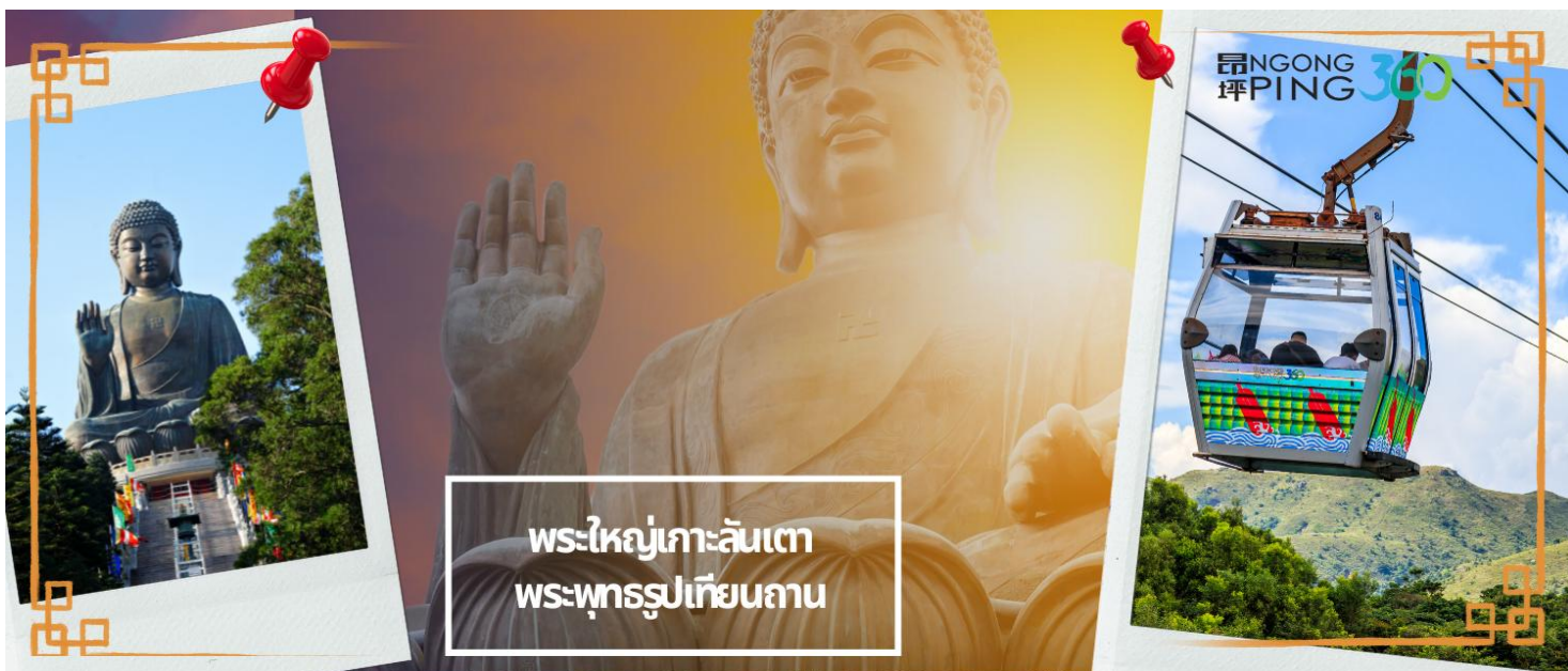
พระใหญ่เกาะลันเตา พระพุทธรูปเทียนถาน

อีสระบริการอาหารกลางวัน ตามอัธยาศัยเพื่อสะดวกในการท่องเที่ยว