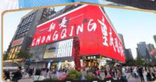
ถนนคนเดินถวณอันเฉียว