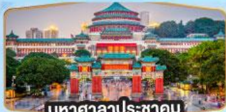
มหาศาลาประชาชน