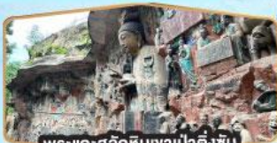
พระแกะสลักหินเขาป่าตึงซัน