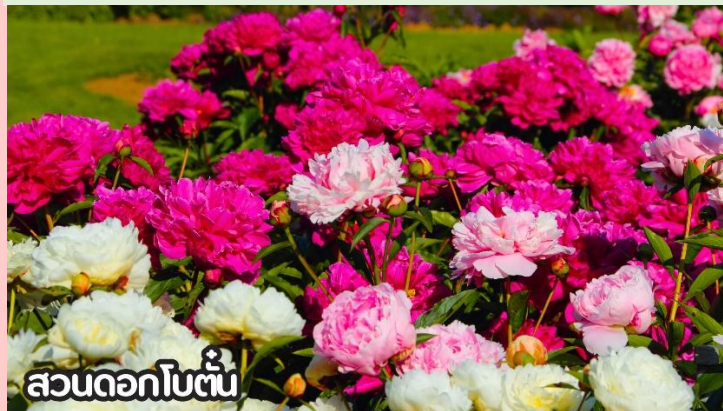
สวนดอกโบตั๋น

ดอกทานตะวันในปักกิ่งบานสะพรั่งสวยงามในหลายพื้นที่ โดยเฉพาะช่วงฤดูร้อนที่สวนป่าโอลิมปิก (Olympic Forest Park) และสวนสาธารณะริมแม่น้ำหยุนหยวน (Wenyu River Park) กลายเป็นจุดชมวิวยอดนิยมที่ดึงดูดนักท่องเที่ยวให้มาถ่ายรูปกับทุ่งดอกสีเหลืองอร่าม เป็นสัญลักษณ์ของฤดูร้อนที่สดใสของเมืองหลวงจีน เดือนสิงหาคม-ต้นกันยายน ชมทุ่งดอกเบญจมาศหรือดอกไฮเดรนเยีย ดอกเบญจมาศปักกิ่งหมายถึงสายพันธุ์เบญจมาศที่มีต้นกำเนิดหรือนิยมปลูกในกรุงปักกิ่ง ประเทศจีน โดยเฉพาะช่วงฤดูใบไม้ร่วง ที่มีการจัดงานมหกรรมดอกเบญจมาศ แสดงความหลากหลายของสีและรูปร่าง มีสายพันธุ์เช่น "กุส่วยจินเสีย" ที่ได้รับรางวัลราชาดอกเบญจมาศ และยังมีเบญจมาศปักกิ่งสีขาวที่เป็นสมุนไพรด้วย ที่สำคัญคือเป็นดอกไม้ที่ใช้ในงานเทศกาลและวัฒนธรรม โดยเฉพาะในสวนสาธารณะ เช่น รื่อถาน และอุทยานเป่ย์ไห่ มีหลากหลายสี เช่น ขาว เหลือง ชมพู แดง และม่วง สามารถพบได้ในหลายพื้นที่