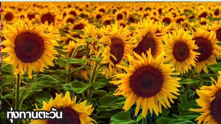
ทุ่งทานตะวัน

จากนั้นนำท่านสู่ถนนหวังฝู่จิ้งถนนคนเดินสุดฮิตใจกลางกรุงปักกิ่ง ปัจจุบันถนนนี้เป็นที่นิยมมากในหมู่นักช้อปปิ้งและนักท่องเที่ยวที่ตบเท้าเข้ามาเพื่อเสาะหาของลดราคาและเสื้อผ้าที่มีเอกลักษณ์ไม่ซ้ำใคร ถนนการค้าที่พลุกพล่านแห่งนี้มีมีม้านั่ง บาร์ ร้านอาหาร