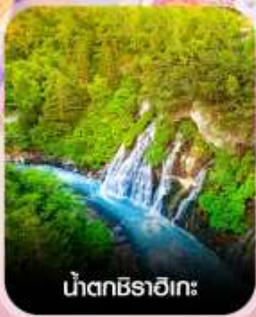
น้ำตกชิราอิเกะ