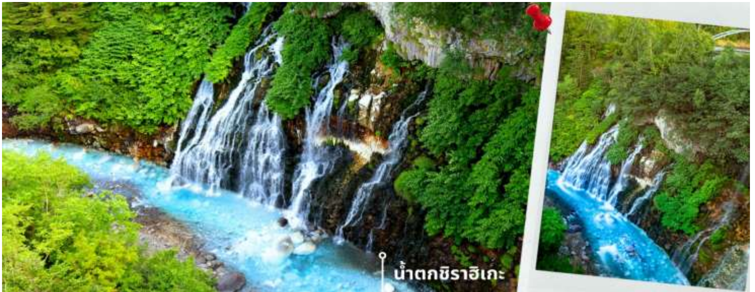
น้ำตกชิราอิเกะ

ก่อนเดินทางสู่เมืองอาซาฮิกาว่า หลังจากนั้นพาท่านเดินทางไปยัง อโณมอลล์ AEON MALL ภายในตัวห้างมีร้านค้าต่างมากมาย ซึ่งตกแต่งในรูปแบบที่ทันสมัยสไตล์ญี่ปุ่นสินค้ามากมายหลากหลายให้เลือกตั้งแต่เสื้อผ้าแฟชั่น อาหารสดใหม่และอุปกรณ์ภายในบ้านรวมไปถึงเครื่องสำอาง ขนมญี่ปุ่นต่างๆและยังมีร้านค้ามากมายไม่ว่าจะเป็น Muji, 100 yen shop, Sanrio store, Capcom games arcade และก็ยังมิซูเปออร์มาร์เก็ตขนาดใหญ่ให้ท่านได้เลือกซื้อของช้อปปิ้งตามอัธยาศัย