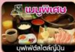
บุฟเฟ่ต์สไตล์ญี่ปุ่น

ชิบโปโร-ชมทุ่งดอกลาเวนเดอร์-โทมิตะฟาร์ม-ซิกิไซโนะโอะกะ-น้ำตกชิราอิเกะ-บ่อน้ำสีฟ้า-อิสระช้อปปิ้งเต็มวัน-พักออนเซน