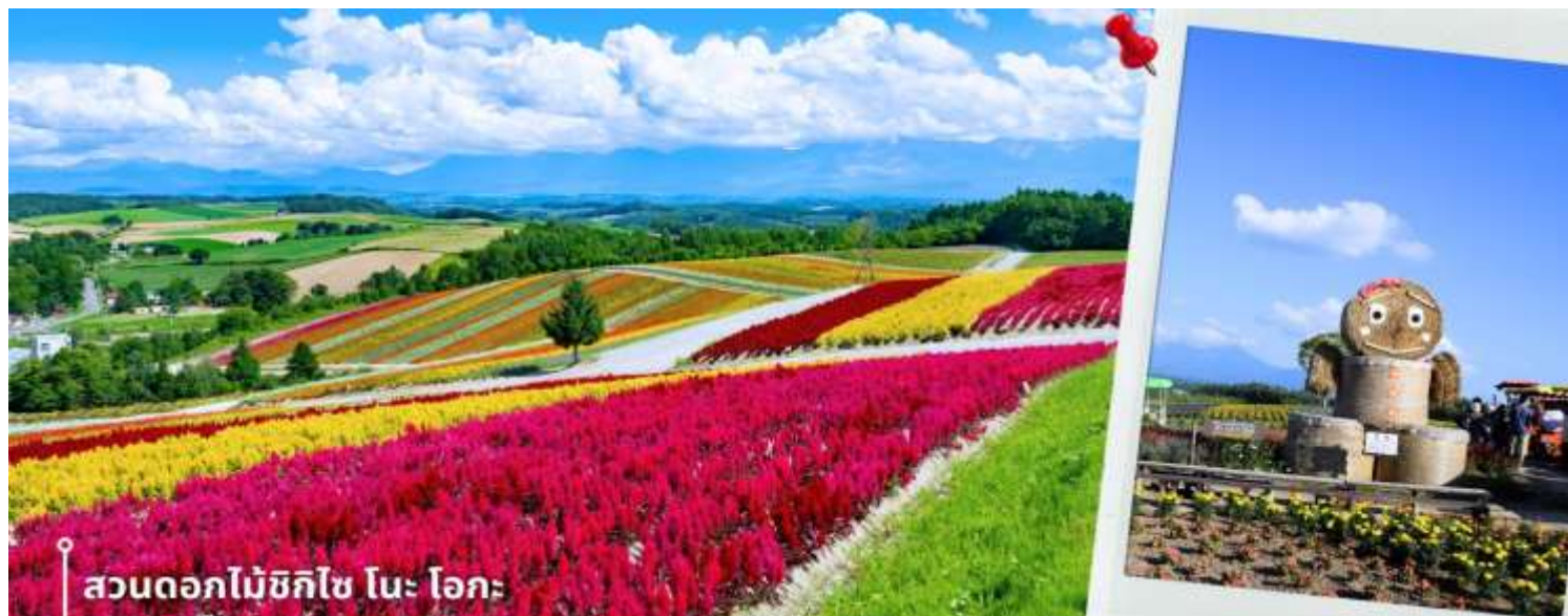
สวนดอกไม้ชิกิไซ โนะ โอะกะ

หลังรับประทานอาหารเช้า นำท่านเดินทางสู่ สวนดอกไม้ชิกิไซ โนะ โอะกะ ชื่อเต็มๆว่า Panoramic Flower Gardens Shikisai No Oka ซึ่งในช่วงซัมเมอร์จะเป็นเนินเขาสีสันสดใสกว้างสุดสายตา พื้นที่กว่า 15 เฮกตาร์ หรือประมาณ 93 ไร่ เป็นสถานที่ที่ได้ชื่อว่า มีความสวยงามทั้ง 4 ฤดู ที่สวนแห่งนี้จะมีดอกไม้หลากหลายสายพันธุ์ ทั้ง ลาเวนเดอร์ ทิวลิป โคเคีย ทานตะวัน และอื่นๆ มากกว่า 30 ชนิดที่สลับกันไปตามฤดูกาล อย่างในช่วงซัมเมอร์ คือ