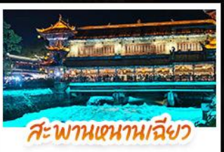
สะพานเทียนเหมินเฉียว